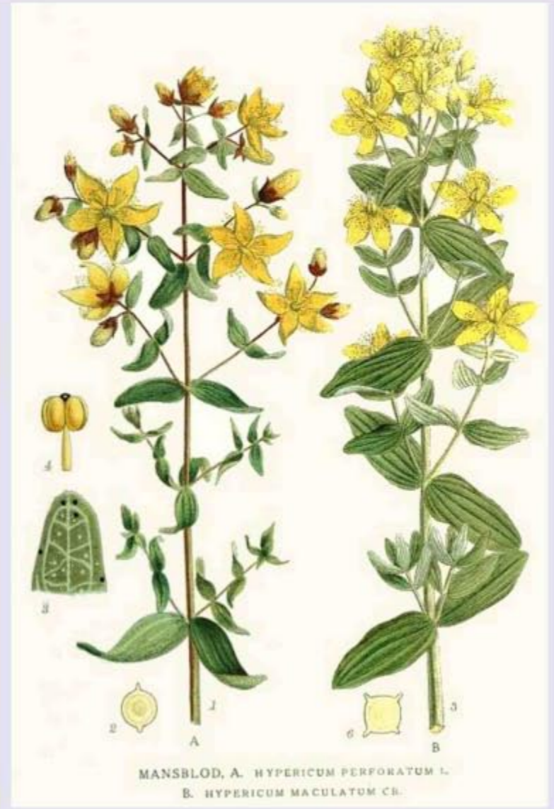
MANSBLOD, A. HYPERICUM PERFORATUM L. B. HYPERICUM MACULATUM CR.